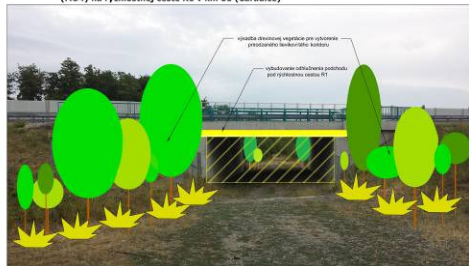
Príloha č. 8: Návrh rekonštrukcie existujúceho migračného objektu (MO4) na rýchlostnej ceste R1 v km 81 (Čaradice)