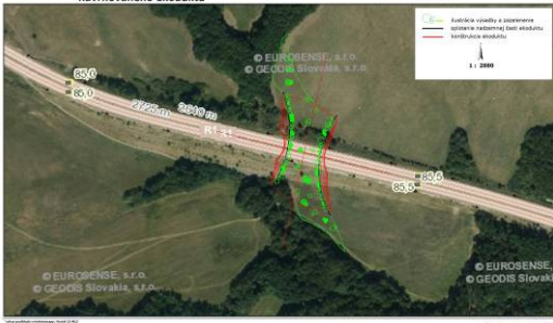
Príloha č. 10: Lokalizácia a územný priemet navrhovaného ekoduktu