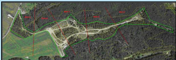
Prehľadná situácia lokalít dendrologického prieskumu