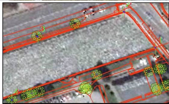
Situácia -ortofotomapa inventarizovaných drevín